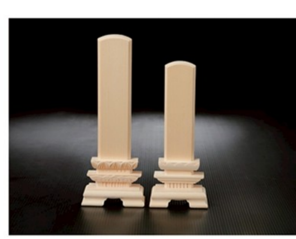
〈白木位牌・埋葬具〉